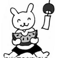
彼がお腹の中いるときスイカばかり食べていたせいか？無類のスイカ好きの息子

前回、「土用」なので養生したい・・・と書きました。が、その土用に食あたり(アレルギー?)で何日も寝込み、その後間髪入れずにぎっくり腰。さらにいくつか併発して、なんだか、しっかりしると発破をかけられた感じでいます(苦笑) だからといって、落ち込んでいないで、いい機会だからといういろいろ暮らしの土台を見直して過ごしているこのごろです。思うように動けないので、わが家の自然農くさ畑は文字通り「草畑」葉草茶を作ったほうがいいのかもかもしれません(笑) 家族はすこぶる元気ですよ。