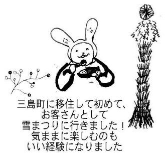
三島町に移住して初めて、お客さんとして雪まつりに行きました! 気ままに楽しむのもいい経験になりました

日はだいぶ長くなりました。が、2月も下旬だというのにまだまだ冷え込みが厳しいこのごろです。春は確かに来るはずなんですけど、雪もまだまだたっぷりです。カフェ部門に続き、お菓子工房でも急ピッチで妻から夫へ製造の引継ぎを行って来ました。まだまだ品揃えは完全ではありませんが、技術・味はとてよく仕上げてくれます。この調子で空色cafe.のお菓子作りを安心して任せられそうです。