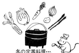
冬の定番料理...わが家ではダッチオーブンが大活躍しています。土鍋やSTAUBよりも、ヘビーローテーションです。

寒中お見舞い申し上げます。今のところ、積雪量も気温も想定できる範囲で収まってくれて、無事冬暮らしをして過ごしています。こう寒くなると、保存していた大根や白菜、じゃがいもはぐっと甘みが増し、煮込みにすればシンプルに塩を振るだけで十分な美味しさです。