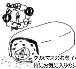
クリスマスのお菓子の中でも特にお気に入りのシュトレン。毎年お取りよせもしています。

ドイツのクリスマス菓子です。バターや洋酒で風味をつけたドライフルーツがたっぷり入った発酵菓子です。どうぞ、薄う〜スライスして、ちびちびとお楽しみ下さい。クリスマス