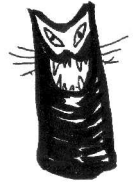
伝説の化け猫・かしや猫のブームが三島町で再来中です!