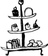
お姫様(王子様)気分になれますよ!

お気に入りの紅茶と、サンドイッチなどの軽食と今回の「おやつ」でアフタヌーンティーはいかがでしょう？