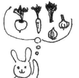
次は、何の種を蒔こうか、楽しみです。

真夏でも、朝晩は涼しい!と自慢の奥会津・三島ですが、日中の暑さには、やはりまっています。お菓子作りの合間には、扇風機と仲良くしています。(調理の熱でじわじわではなく)運動をして汗をしっかりと、ずっと体の調子がいんだらうなあと思いながら。そう、向日葵は、ずいぶん大きくなり、今は、ずっとし種をつけて頭を垂れています。アサガオやフウセンカズラは、少しずつ咲いていて...残念ですが、グリーンカーテンには、数が足りませんでした。でも、眺める楽しみになっています。